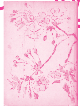
太宰治 『右大臣実朝』 昭和18年(1943) 錦城出版社