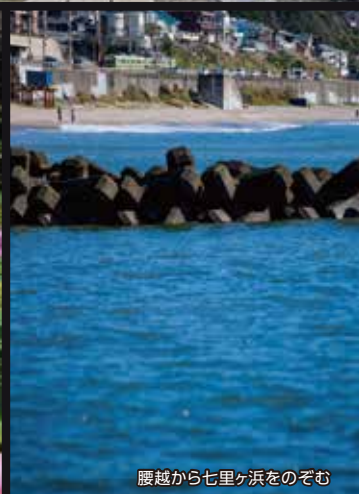
腰越から七里ヶ浜をのぞく